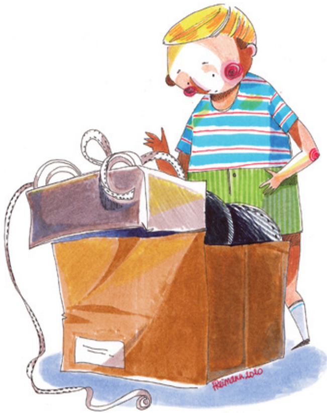
REIMANNI HILDEGARDI TSEHKENDÜS

Suurõ projektori ratta kä-vevä viil surinaga ümbre ja